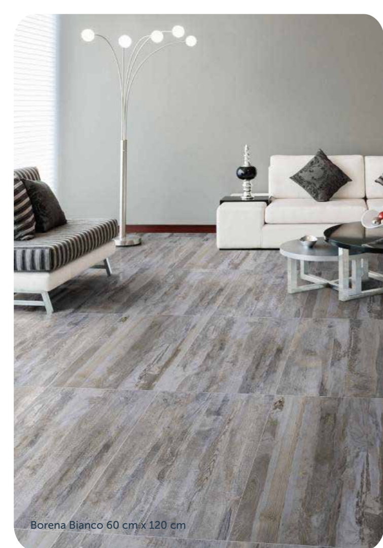
Borena Bianco 60 cm x 120 cm